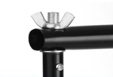
Fije los extremos del travesaño en el extremo del trípode