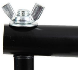
Instale la tuerca y atorníllela a mano