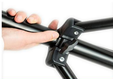
Abrir la base del trípode