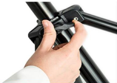
Apriete el perno de seguridad