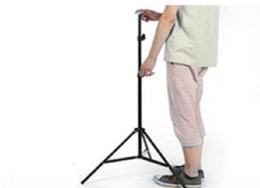
Ajuste la altura y apriete el perno