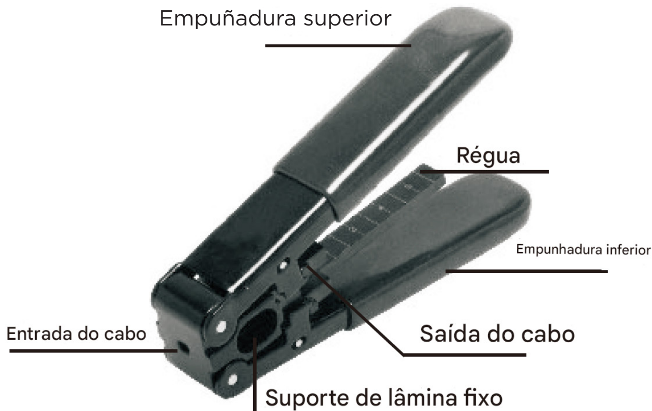
Diagrama de cabos de alicate para cabos ópticos com isolamento de caucho