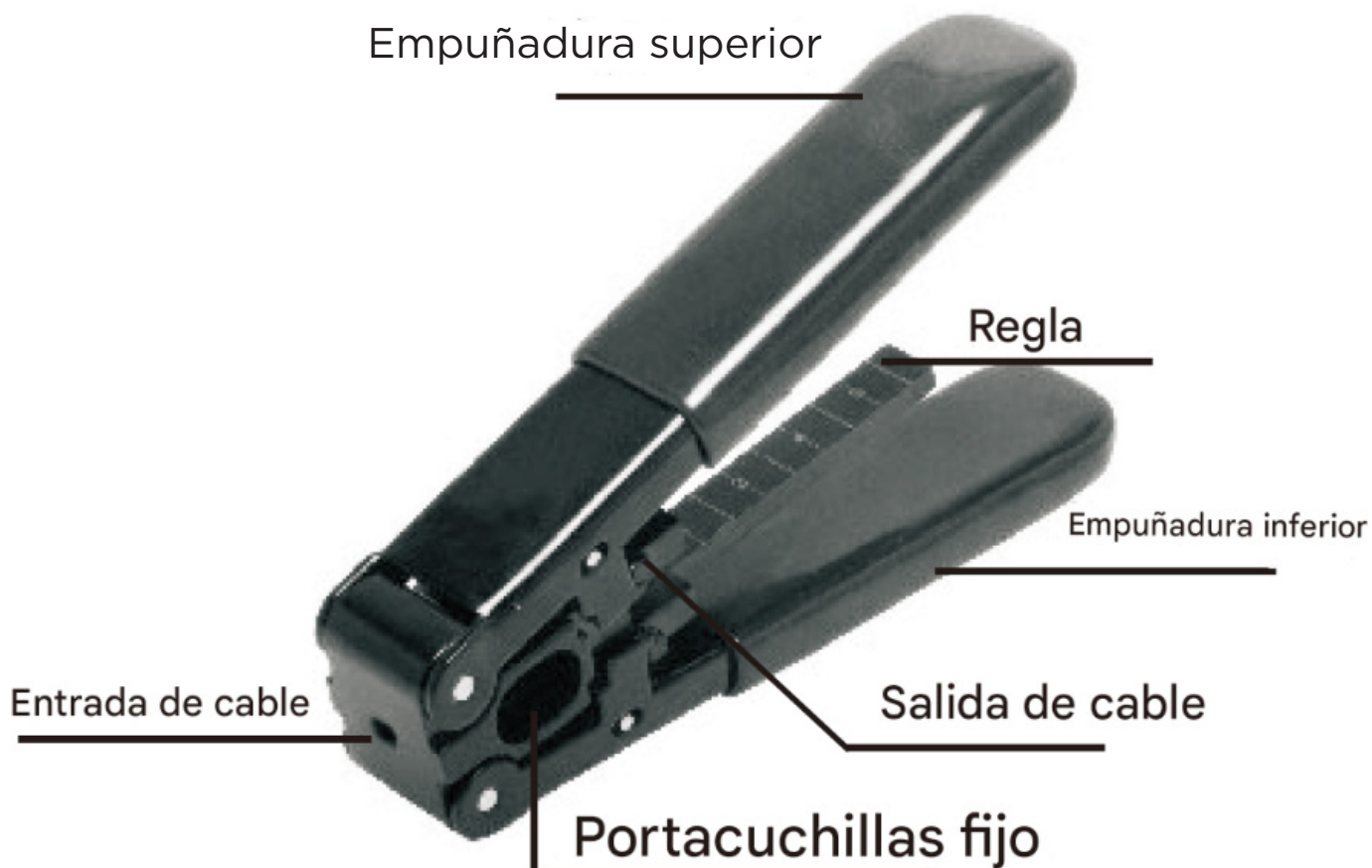
Diagrama de alicates pelacables para cables ópticos con aislamiento de caucho