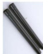
Tubo de plástico