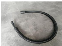
Montaje de la manguera