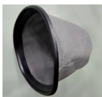
Bolsa de polvo