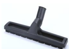
Cepillo de suelo