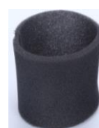
Filtro de esponja