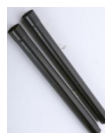
Tubo de plástico